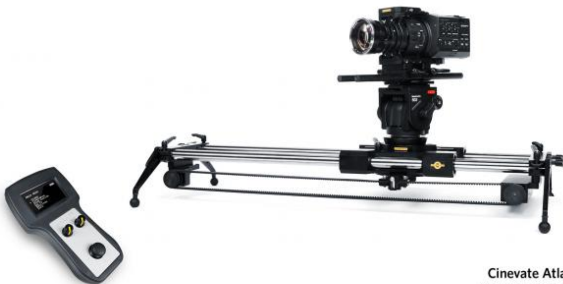
Cinevate Atlas 200 Powered by DitoGear